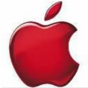
Apfel ist rot