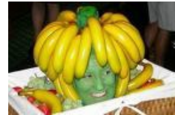
Banana ist gelb