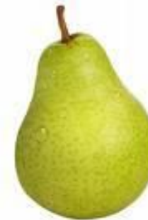
Birne ist grün