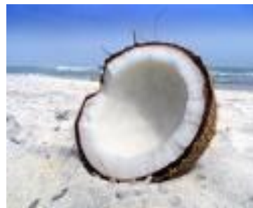
Kokosnuss ist weiss