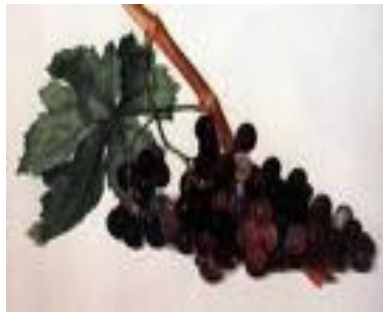
Trauben sind schwarz