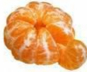
Mandarin ist orange